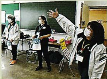
じゃんけんに勝ったらカードを引けます