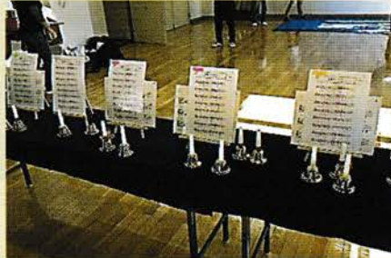
色付けされた楽譜に合わせてベルを振ります