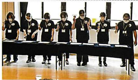
ミュージックベル