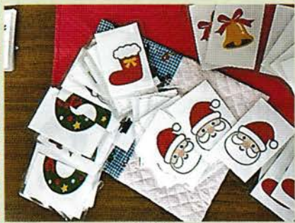
絵柄のカードを揃えるチーム対抗のゲームです