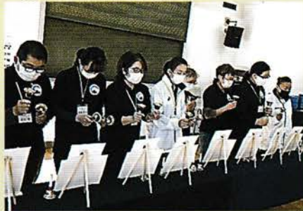
演奏メンバーで、それぞれ音階を担当し、指揮に合わせて曲を奏でます