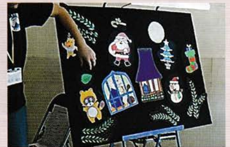
音楽に合わせて順番に貼ります