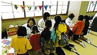
青少年育成のつどい 講演会や子どもたちに向けてまつりなど企画開催しています