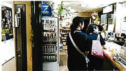
社会環境実態調査 県から委託され各店舗の実態調査を行います