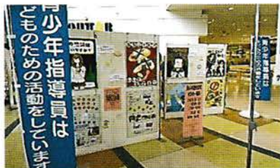
青少年健全育成ポスター展示 市立中学校に依頼し生徒がポスターを制作しています