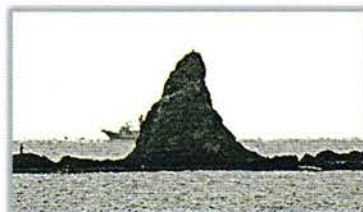
茅ヶ崎サザンCの中から見える「えぼし岩」 ロゴマークのイメージ

え：笑顔があふれる研修しながら ぼ：ボランティアで健全育成の活動 し：市民のみなさんに広報紙などで い：いっぱい活動を知ってほしい わ：私たちは青少年指導員です