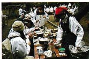
全体会 青少年指導員の交流を深める事業です