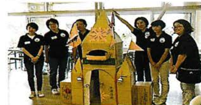
行政研修 青少年指導員としての資質向上をはかる研修です