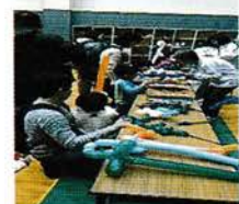
ちがさきスポーツ・レクリエーションフェスティバル