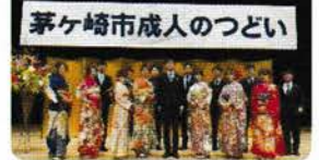
※毎年、市内中学校卒業生の代表と 青少年指導員の代表が実行委員として活動しています