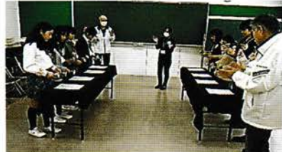
青少年会館フェスタ 子どもたちがミュージックベルを体験しています