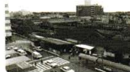
1985年頃、解体前の茅ヶ崎駅