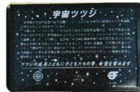
※中央公園内に植樹、設置