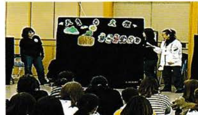
子ども会新役員研修会 新役員の方々に子ども向けのゲームや備品を紹介しています