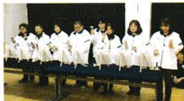
県立茅ヶ崎養護学校文化祭