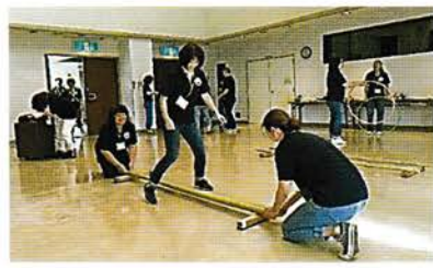
指導員研修 各自のスキルアップのための研修会です