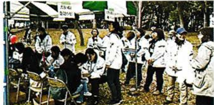
市民ふれあいまつり 青少年健全育成ポスター展示やバルーンアートの指導を行います