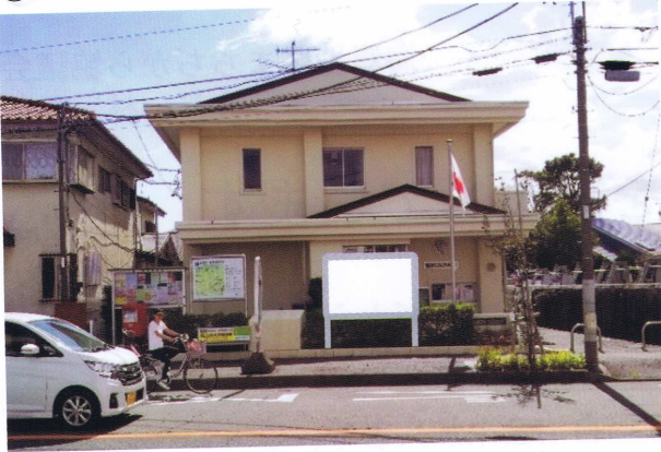
① 海岸地区コミュニティセンター