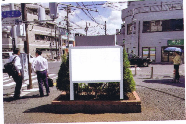
② 鉄砲道と雄三通りの交差点の南西角